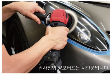
*사진의 양모버프는 시판품입니다.