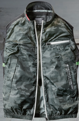
쿨링 자켓 BCJ001